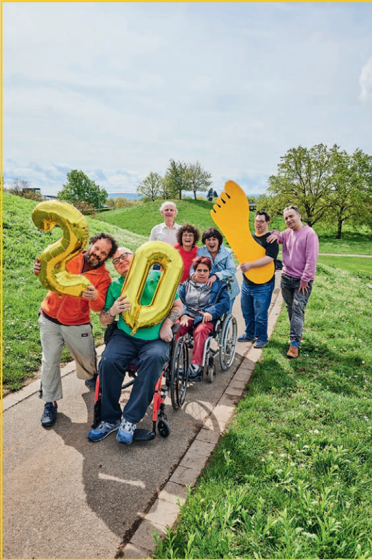
Inklusive Theatergruppe DIE SPINNER