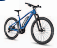
Zum Beispiel ein hochwertiges E-BIKE der Marke Scott ...

Mitmachen und Preise im Wert von 10.000 EUR gewinnen.