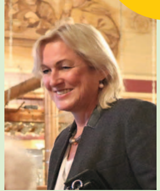
Einladung aller Mitglieder und weiteren Gästen im Brauhaus Kühler Krug.