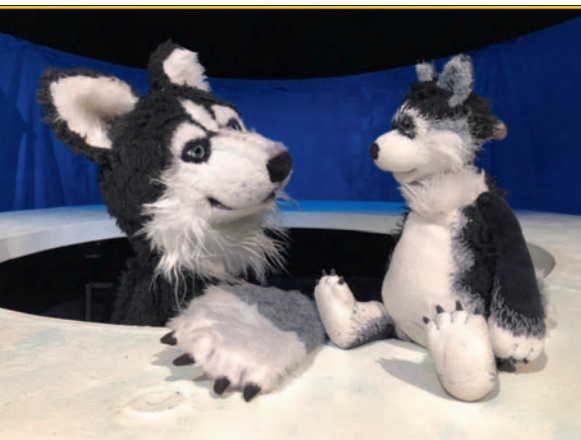
Kleiner Eisbär, lass mich nicht allein