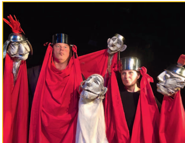
The Bright Side of Life