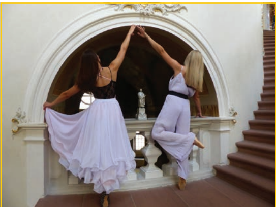
Tänzerinnen im Schloss mit einer, dem Lutherdenkmal nachempfundenen Spieluhr