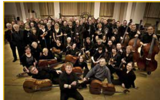
Stamitz-Orchester Mannheim